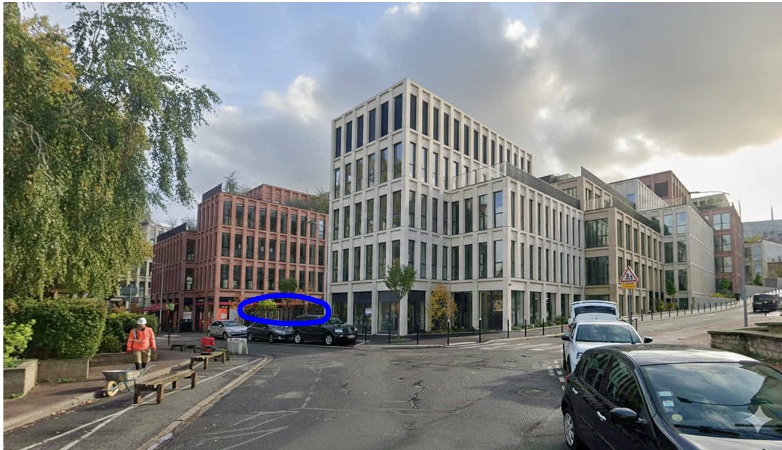
PC-06.1 insertion du projet